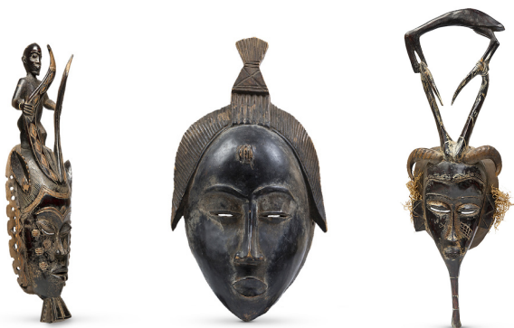
MŻo/A/3562, MŻo/A/3563, MŻo/A/3564 Polskie poznawanie świata