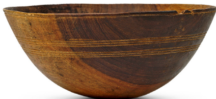
MŻo/A/4001 Polskie poznawanie świata